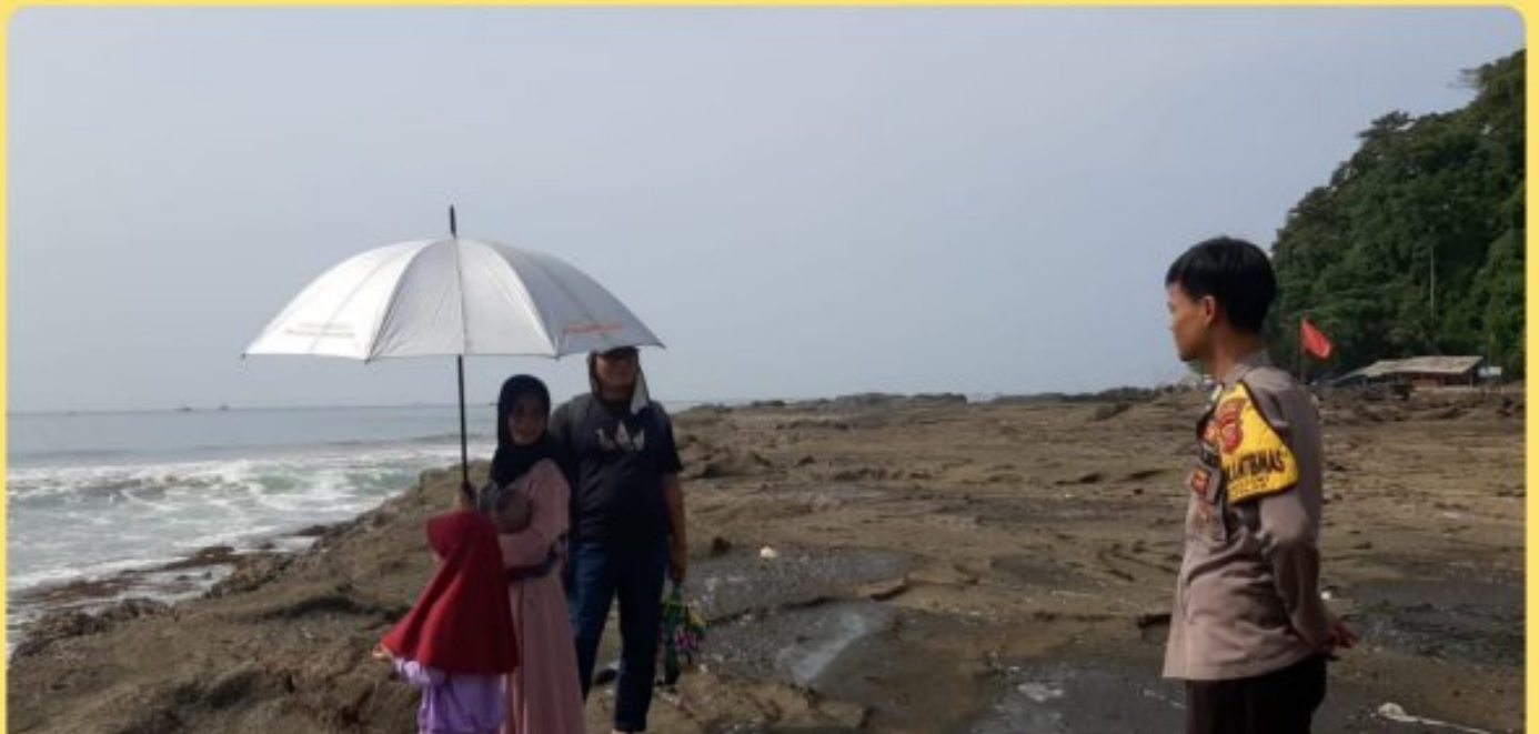
Upaya Polsek Cisolok Polres Sukabumi Jaga Kamtibmas dan Cegah Kejadian Laut

Giat Patroli Pantai Dalam Rangka Harkamtibmas Dan Cegah Laka Laut di Sekitar Wilkum Polsek metro