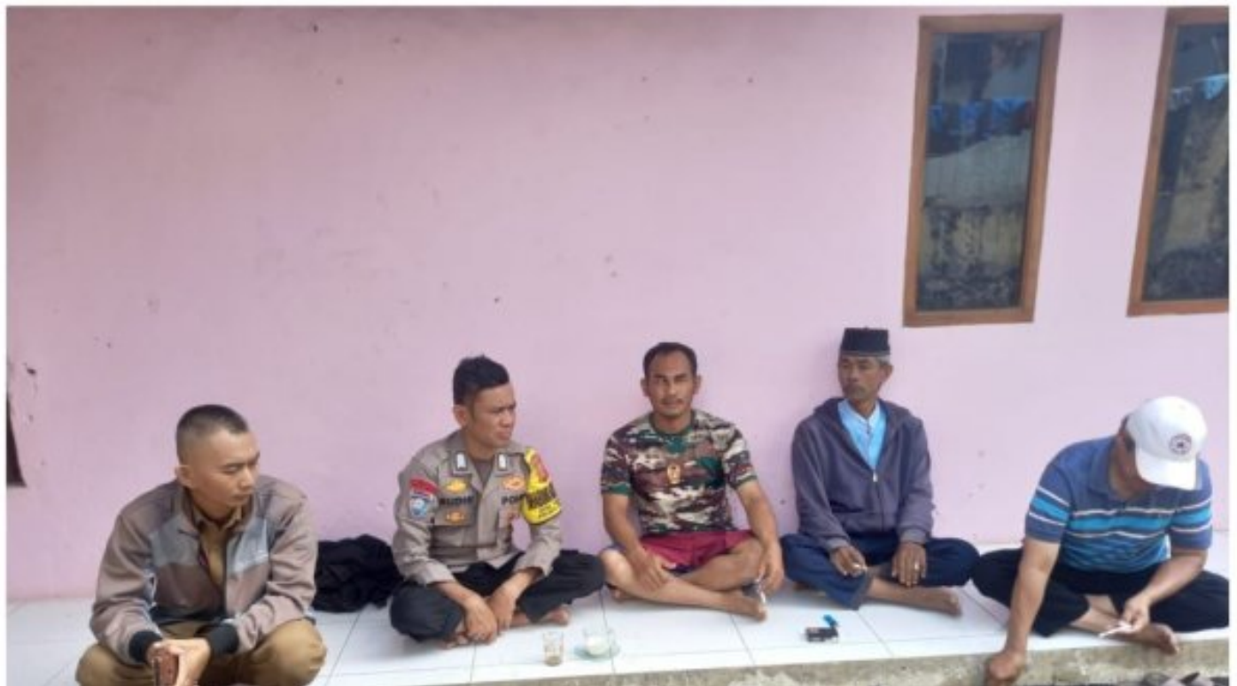
Bhabinkamtibmas Polsek Cidahu Polres Sukabumi Jalin Silaturahmi Lewat Door to Door System