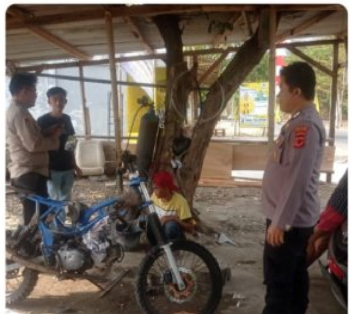
Bhabinkamtibmas Desa Tonjong Polsek Palabuhanratu Polres Sukabumi Giat Sambang Door to Door System untuk Jaga Harkamtibmas

SUKABUMI - Dalam rangka menjaga Harkamtibmas, Bhabinkamtibmas Desa